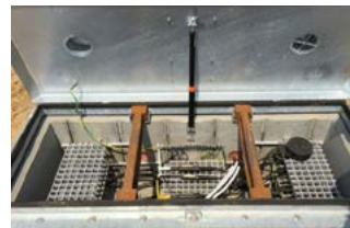
Brussels Airport Renovatie startbaan Brussels Airport