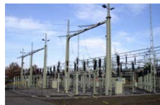
Tilburg West Uitbreiding onderstation Enexis