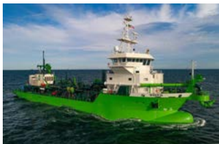
Minerva TSHD Royal IHC