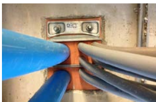
Groene Hart ziekenhuis Nieuwbouw ziekenhuis GHZ