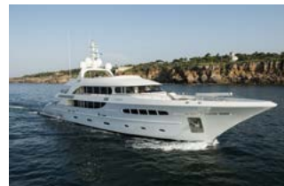
Nassima Motor jacht Accio yachts