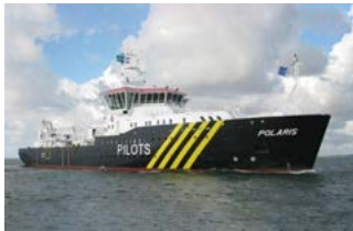
Polaris Pilot vessel Barkmeijer