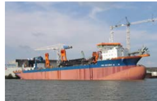
Vox Maxima Mega hopper dredger Royal IHC