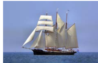
Gulden Leeuw Zeiljacht Koninklijke Scheepswerf Balk