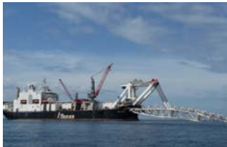
Audacia Pipe laying vessel Damen Keppel