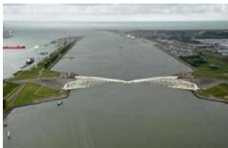
Maeslantkering Deltawerken Rijkswaterstaat