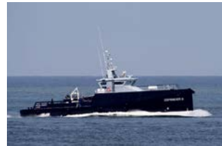
Defender II Fast Crew Supplier Damen Shipyards